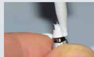
Multilink Hybrid Abutment jest aplikowany na tytanową bazę.