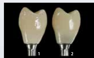
Korona hybrydowa cementowana na Multilink Hybrid Abutment HO 0 (1), w porównaniu do korony cementowanej na materiał o regularnej translucencji (2).